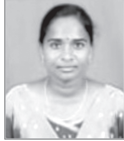
Anbudevi Commercial Assistant Villupuram EDC