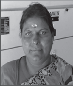
G. Pattu Field Assistant, Chennai south 2 EDC