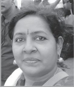
Mangai CHD Head Quarters Chennai