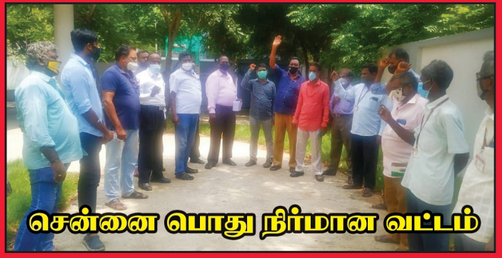
சென்னை பொது நிர்மான வட்டம்